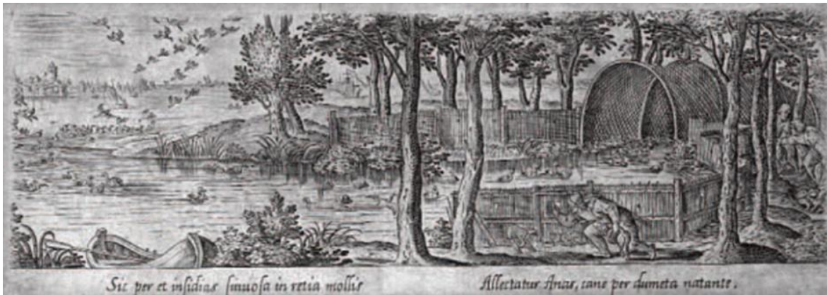
Gravure uit 1582 naar Hans Bol

Het vangen van eenden was een jachttechniek die tijdens het winterhalfjaar werd uitgevoerd. Men gebruikte daarbij een groep lokeenden of zogenaamde 'staleenden' die, zwemmend op de kooivijver, groepen wilde eenden aantrokken. Bij het vangen lokte de kooiman de tamme eenden met een fluittoon om een voederbeurt aan te kondigen. Om de eenden in de vangpijp te lokken gebruikte men doorgaans ook één of meerdere honden die rondjes liepen langs de pijp. 3 Voor de wilde vogels is het alsof er verschillende honden achter elkaar naar het einde van de vangpijp lopen. De nieuwsgierig geworden vogels volgen de hond(en) en werden zo in de vangpijp gelokt. Daar werden ze tenslotte, onbeschadigd en vakkundig, de nek omgedraaid. Bij de vangfuik stond soms nog een spartelhok opgesteld.