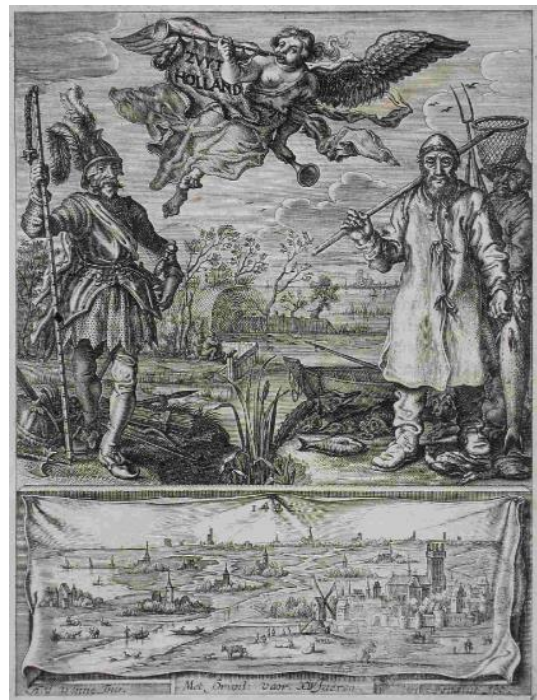
Gravure van Victor Rijckelsma uit 1621 (links) en van Willem Hondius uit 1623 (rechts)

De oudste afbeelding van de eendenvangst bij een vangpijp komt uit de school of is getekend in de stijl van de Duitse tekenaar en schilder Virgil Solis (1514-1562) die werkte in Nuremberg. Het is een houtsnede die vermoedelijk gemaakt is circa 1530-1540 en model stond voor verschillende kopieën. In een gravure uit 1582 naar Hans Bol, gebaseerd op de oudst bekende houtsnede, wordt een vangpijp getekend langs de rivieroever en een zwemmende hond. Het onderschrift luidt vertaald: "Zo wordt ook met listen de malse eend in de gebogen netten gelokt, terwijl een hond door het struikgewas zwemt"