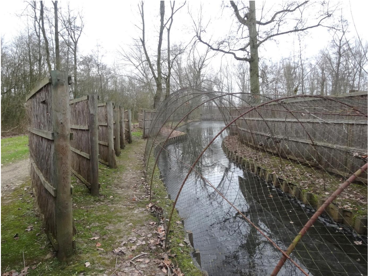
Eendenkooi van het Donkmeer in Uitbergen (Berlare)