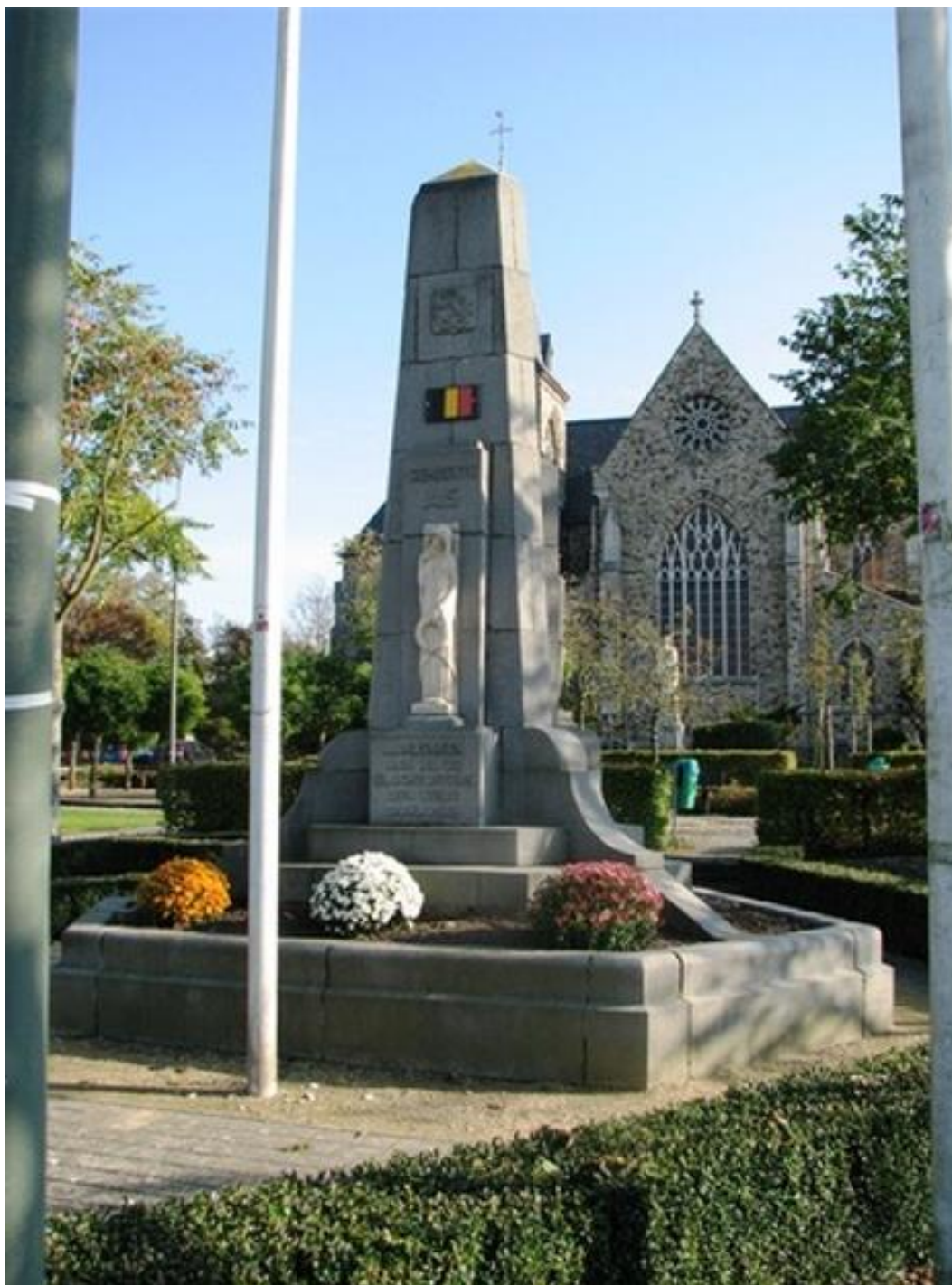
Figuur 3. As, Kerkplein, oorlogsgedenkteken (1950) nov architect J. Reumers: toestand 2011 https://beeldbank.onroerendergoed.be/images/185714 .