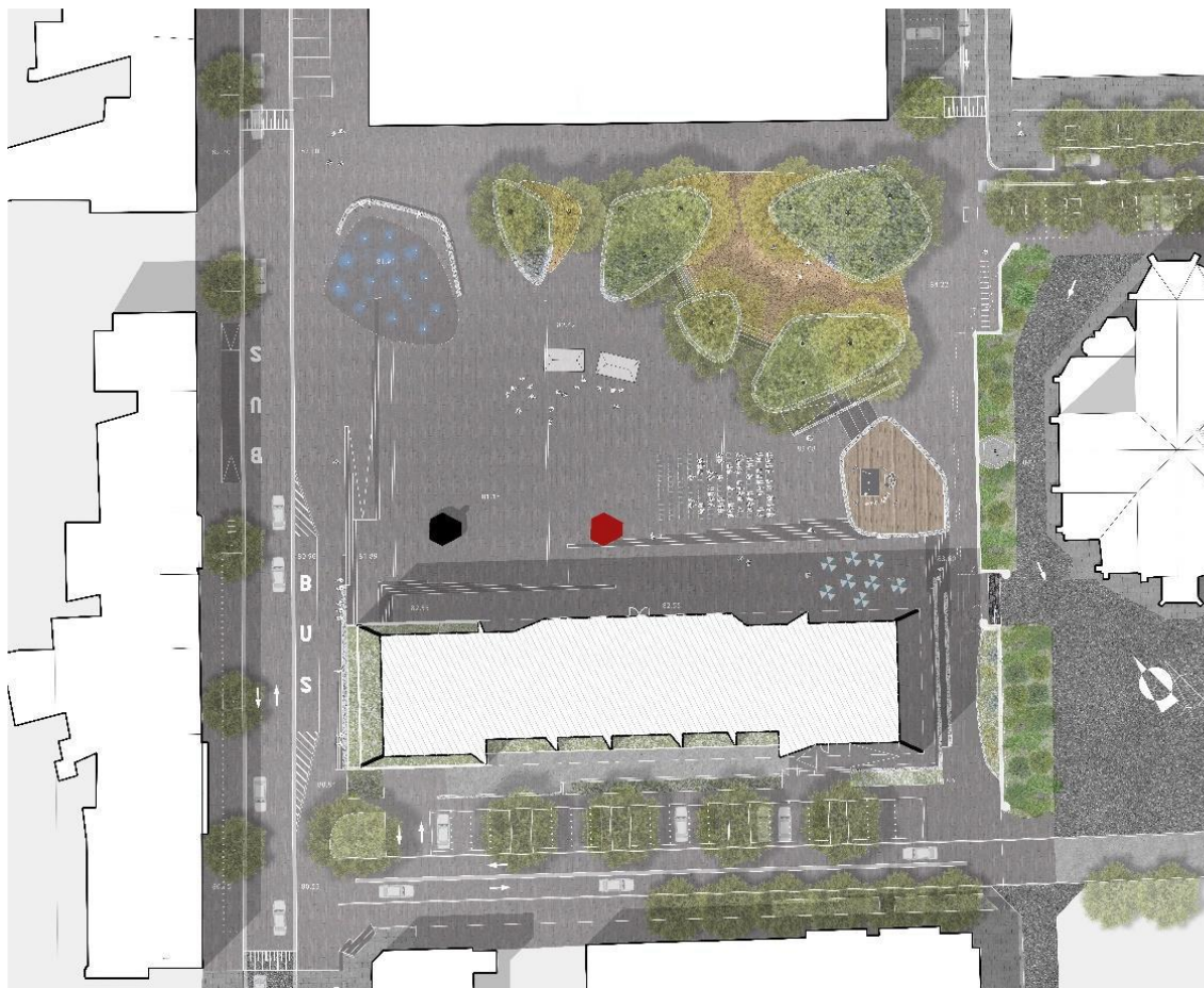
Figuur 4. Nieuw pleinontwerp: bestaande locatie oorlogsgedenkteken in het rood aangeduid en nieuwe locatie oorlogsgedenkteken in het zwart aangeduid (afkomstig uit: DE BEUKELAER K. 2019: Aanvraagdossier voor verplaatsing oorlogsmonument, Kerkplein , onuitgegeven rapport studie bureau Sweco).