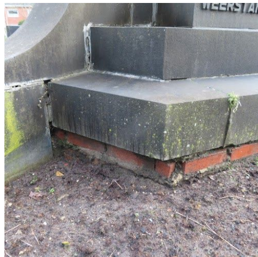
De huidige bakstenen basis is weinig waardevol en mag verdwijnen.