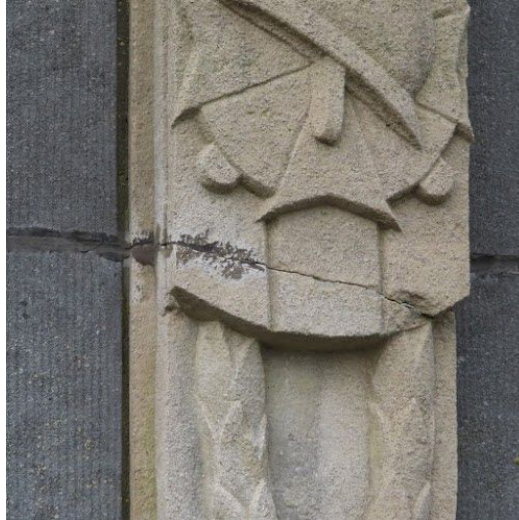
Breuken in de Euvillesteen

uit te voeren door Natuursteenbewerker | Restaurator