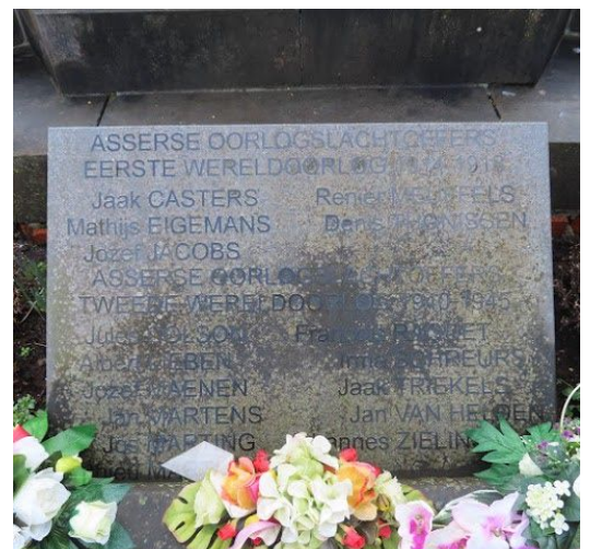
Vervaging van de inscripties.