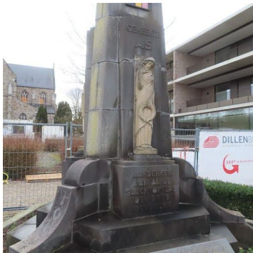
Ieder onderdeel heeft zijn eigen positie. Dit moet nauwkeurig worden gedocumenteerd.

indicatieve hoeveelheid 1 SOG prioriteit 1-3 jaar frequentie Eenmalig uit te voeren door Natuursteenbewerker | Restaurator