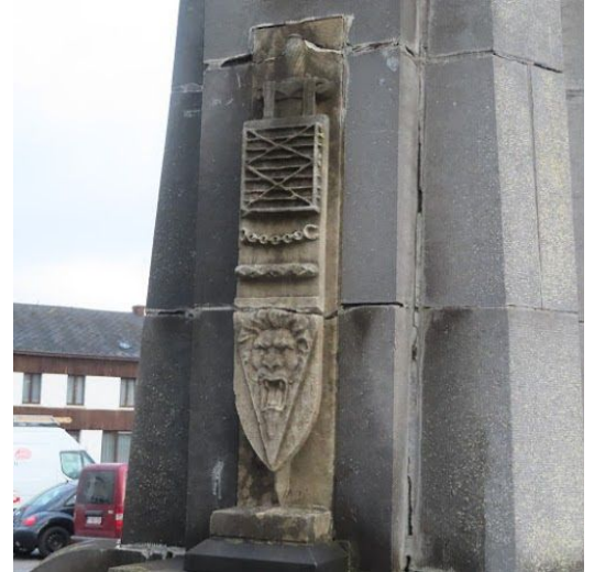
De stenen kunnen worden gereinigd.