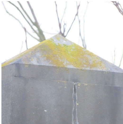
Algen en korstmossen kunnen gemakkelijk worden gereinigd.