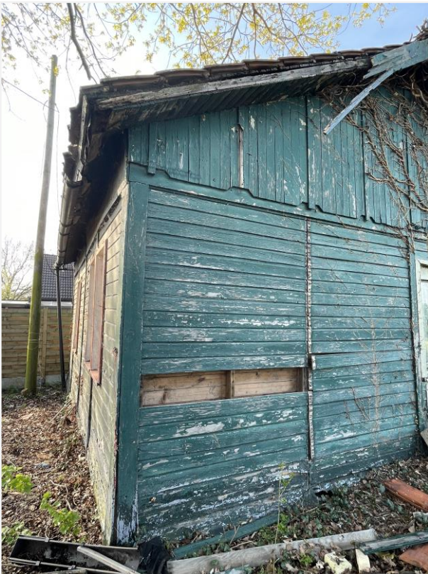
Foto 11: Noordwestelijke zijde. 21 april 2023.