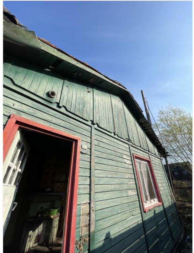
Foto 2: Voorzijde noodwoning. 21 april 2023.