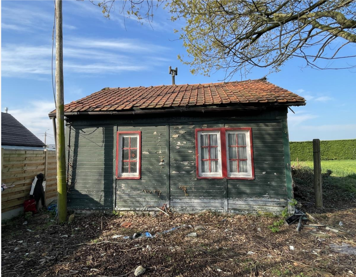
Foto 8: Noordoostelijke zijde. 21 april 2023.