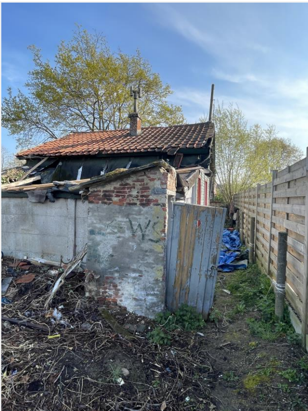
Foto 15: Zuidwestelijke zijde met toilet en stalletje. Foto Architecten Beeck & Hermans, 21 april 2023.