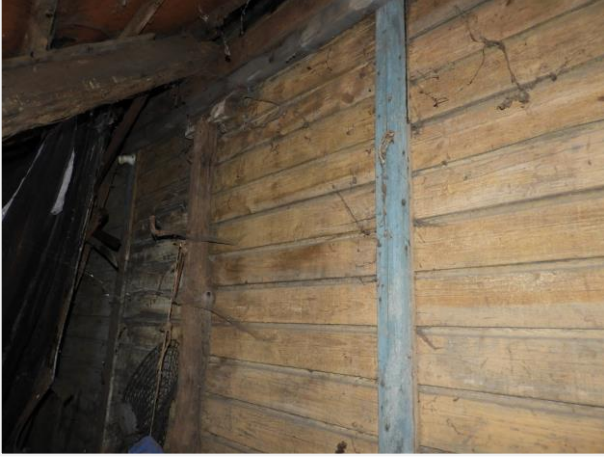
Foto 17: Houten buitenwand aan linkerkzijde (vanuit stalletje). Foto Agentschap Onroerend Erfgoed, 19 december 2024.