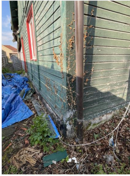
Foto 6: Hoek voorzijde – noordoostelijke zijde. Foto Architecten Beeck & Hermans, 21 april 2023.