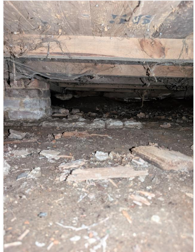
Foto 18: Onderzijde houten roostering vloer. Foto Agentschap Onroerend Erfgoed, 19 mei 2026.