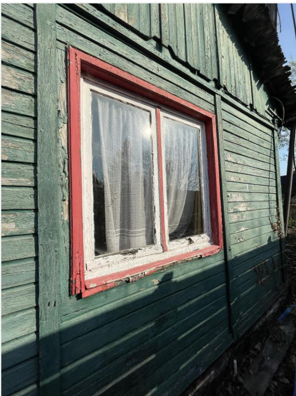
Foto 3: Raamopening voorzijde. 21 april 2023.