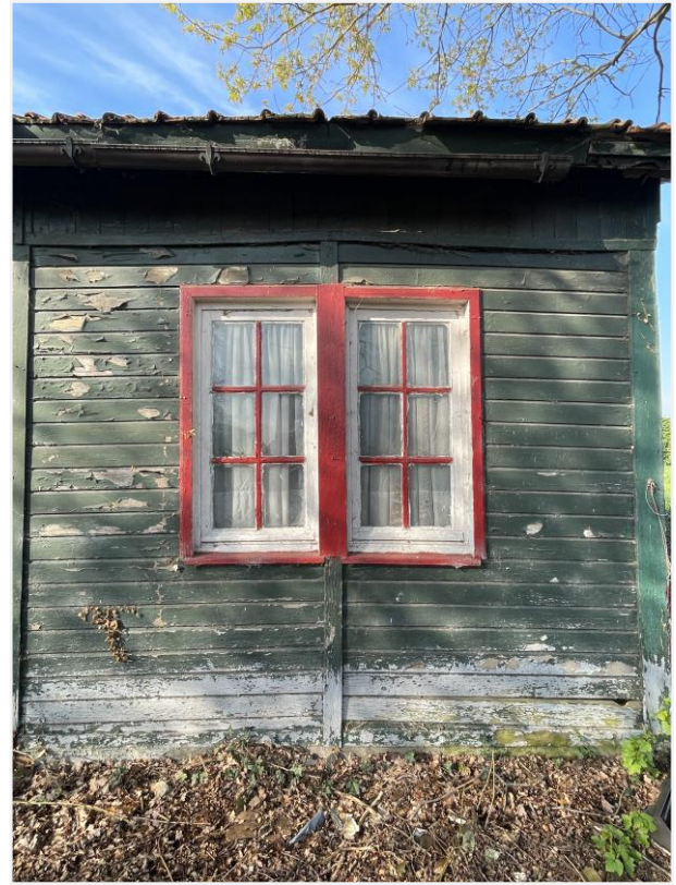
Foto 10: Twee gekoppelde enkelvoudige raamopeningen noordoostelijke zijde. Foto Architecten Beeck & Hermans, 21 april 2023.