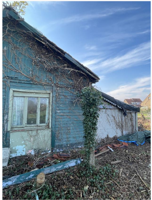
Foto 14: Noordwestelijke zijde. Foto Architecten Beeck & Hermans, 21 april 2023.