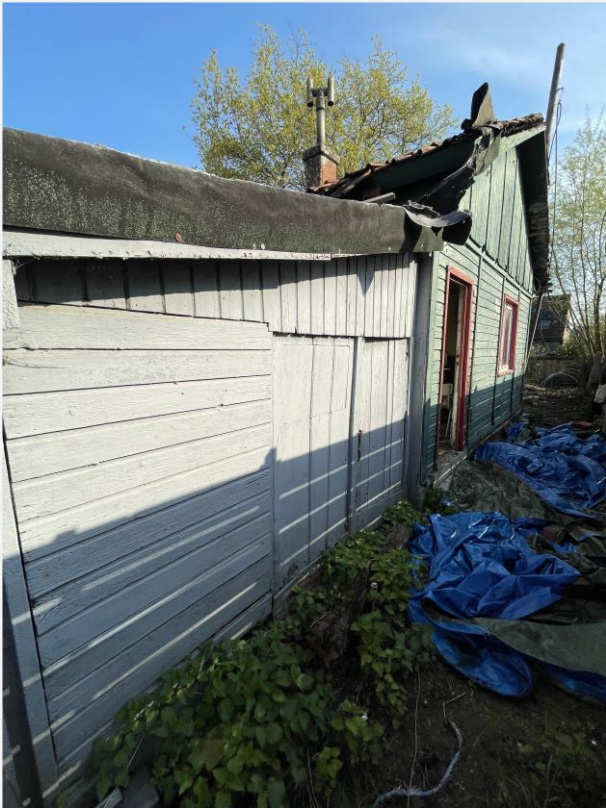
Foto 1: Voorzijde noodwoning. Foto Architecten Beek & Hermans, 21 april 2023.