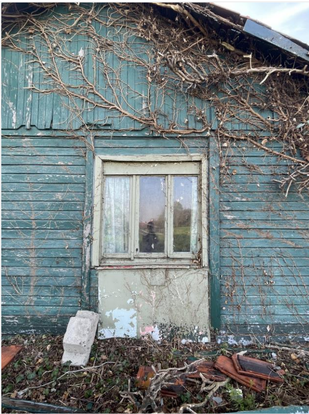
Foto 13: Noordwestelijke zijde. Foto Architecten Beeck & Hermans, 21 april 2023.