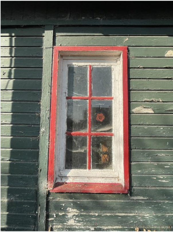
Foto 9: Enkelvoudige raamopening noordoostelijke zijde. Foto Architecten Beeck & Hermans, 21 april 2023.