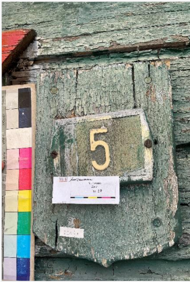
Foto 5: Schildje met huisnummer. 19 december 2024.