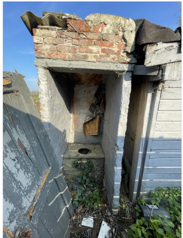
Foto 16: Toilet. 21 april 2023.